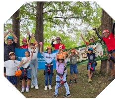
ツリークライミング