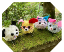
ワークショップ 【モスペット】