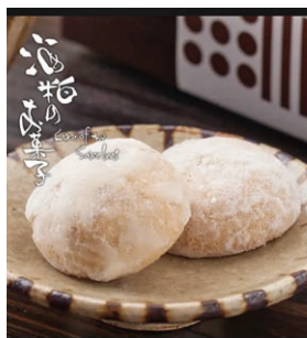
②甲賀流白玉爆弾ポルポローネ