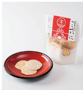
④京丹後せんべい(こっぺがに)