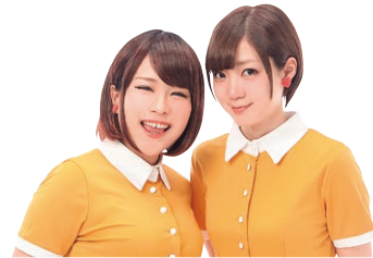
ドキドキ純情ガールズ