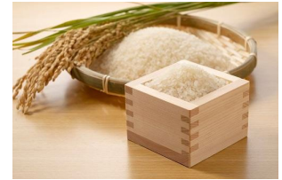
タイムアタック部門 C コシヒカリ 5 kg (京丹後市) ※写真はイメージです