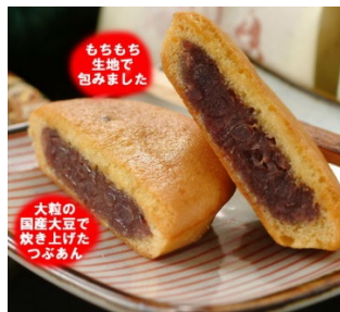
駅伝参加特典 がちやまん5個入り (京丹後市) ※写真はイメージです