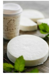
タイムアタック部門 B 牧場のチーズケーキ (京丹後市) ※写真はイメージです