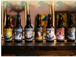
タイムアタック部門 A クラフトビール3本セット (京丹後市) ※写真はイメージです